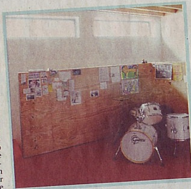
In de hele loft wordt veel onbewerkt hout gebruikt. «Dat past goed bij de ruwe stijl.»