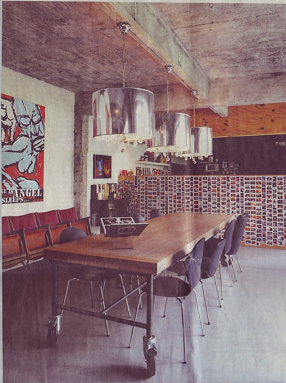
Het ruwe betonnen plafond ondersteunt het industriële karakter van de loft. «Dit pand was oorspronkelijk een garage waar tractoren werden gemaakt.»