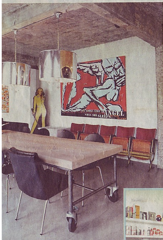
Cinemastoeletjes die het koppel ooit op de rommelmarkt vond, zorgen voor een leuke retrotoets.

Het bad op poten staat in het midden van de ruimte en geeft een luxueus gevoel. De gordijnen die het bad afschermen van de slaapkamer zijn van een toneelbedrijf. Grappig detail is een rozet boven het bad. Tegenover het bad is er een regendouche. Nathalie en Kristof wilden een volledig egale douche zonder tegels. Ze lieten die bespuiten in materiaal dat voor de