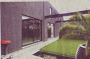
«Vroeger was de tuin overdekt, maar dat dak hebben we weggehaald. De balken mochten wel blijven. In de zomer hangen we er een schommel en een hangmat aan.»