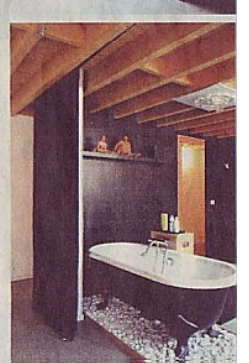
Bad- en slaapkamer sluiten naadloos op elkaar aan. Origineel is het bad dat op een platform met keitjes staat.