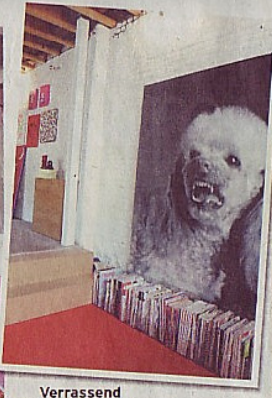
Verrassend is de kunstfoto van de boze poedel.