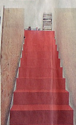
De trap is felrood geschilderd. In het blok ernaast zit het toilet.