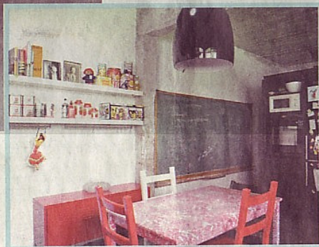
Rode accenten zoals de keukenstoelen vormen een warm tegengewicht voor het grijze beton. De tafel is geplastificeerd.